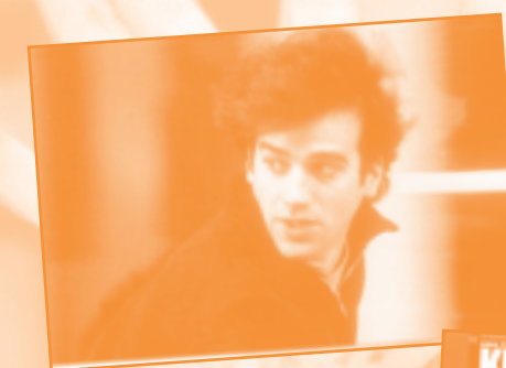
Le fils d'Élias