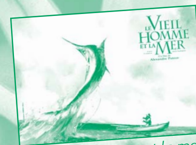
Le vieil homme et la mer